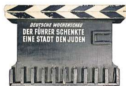
Filmová klapka s nápisem Německý týdeník - Vůdce daroval Židům město