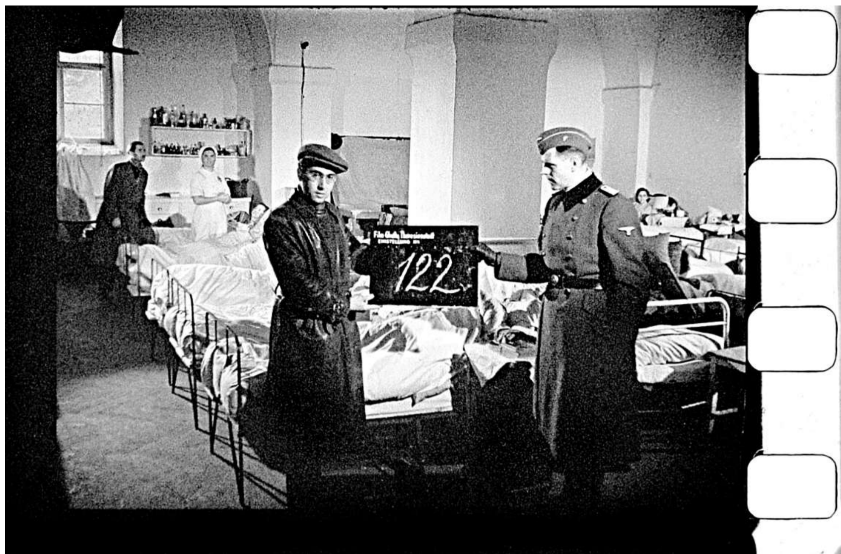
Manipulace. Z výstavy „Pravda a lež. Filmování v terezínském ghettu 1942–1945“, která byla letos instalována v pražské Galerii Roberta Guttmanna